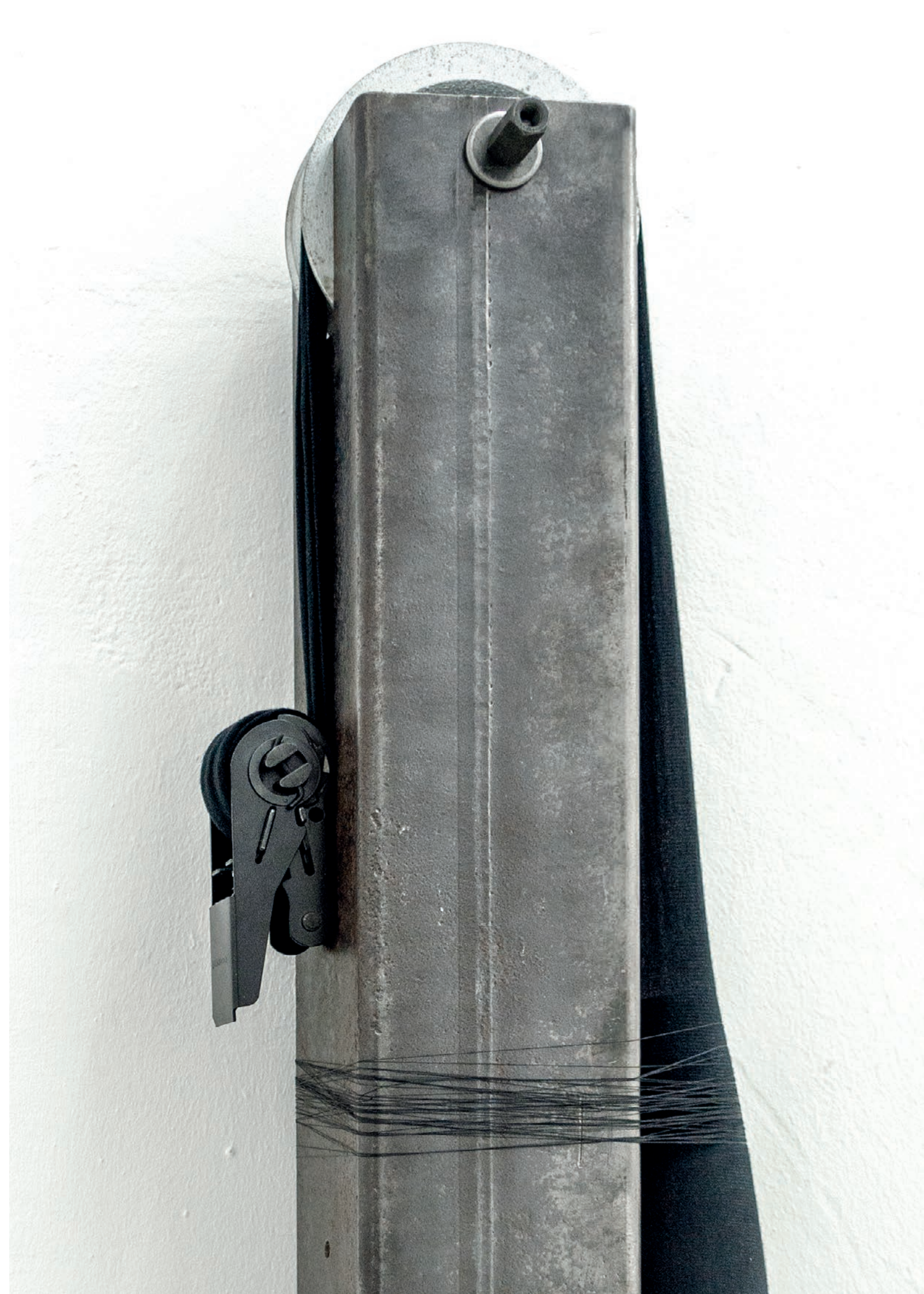
Detail Jonas BüBecker SP19B1