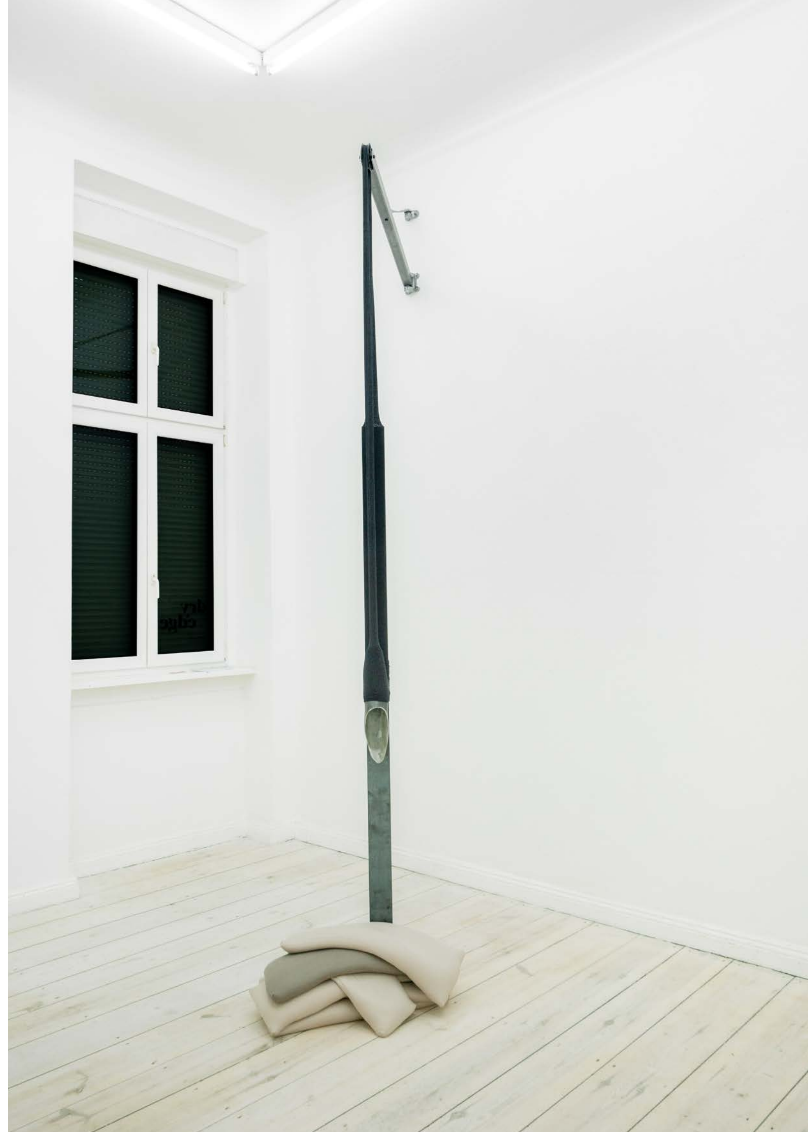
Jonas Bübecker S17B1 Metall, Jersey, Sandsäcke / Metal, jersey, sandbags 360 x 140 x 110 cm · 2023