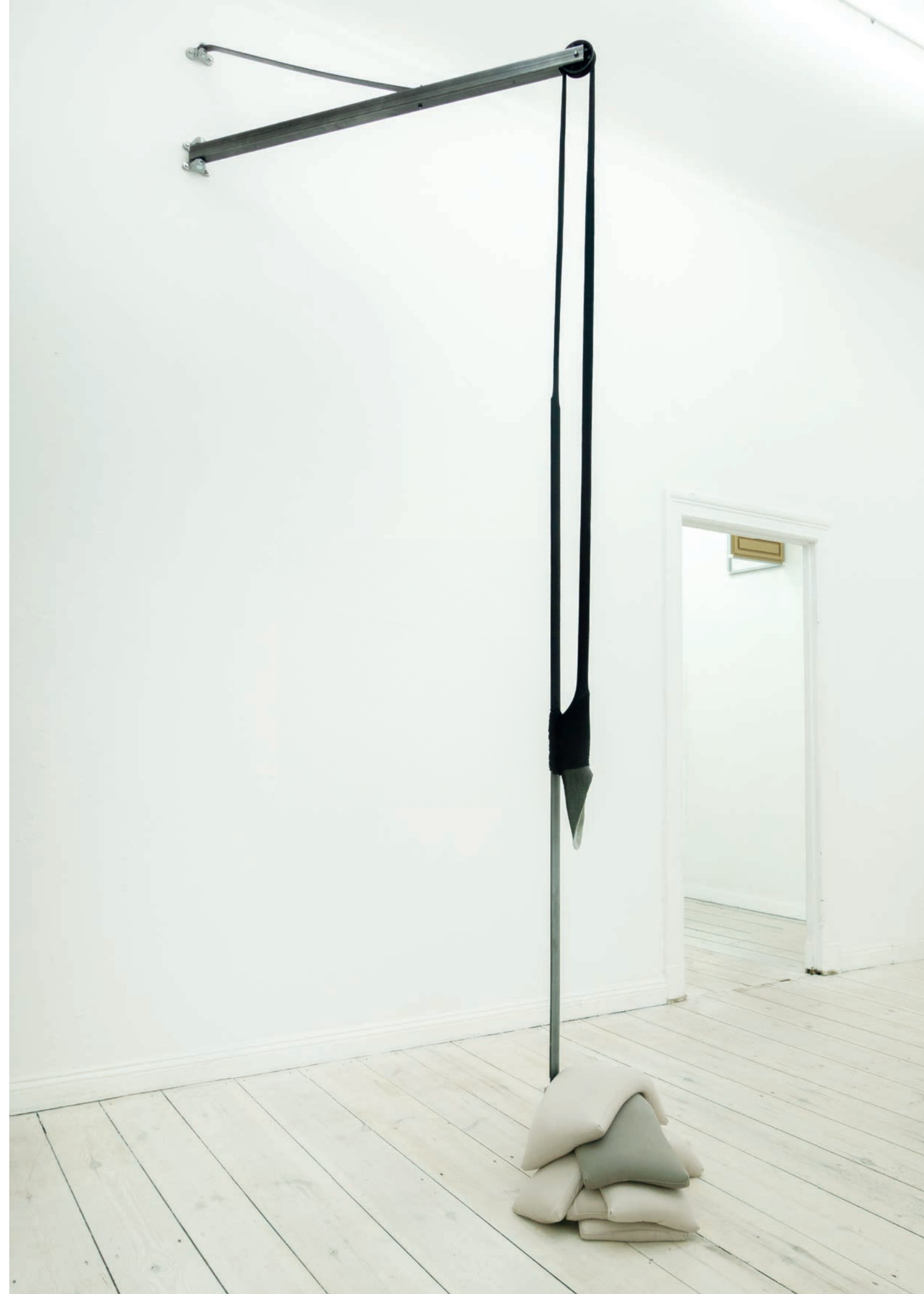
Jonas Bübecker S17B1

Metall, Jersey, Sandsäcke / Metal, jersey, sandbags 360 x 140 x 110 cm · 2023