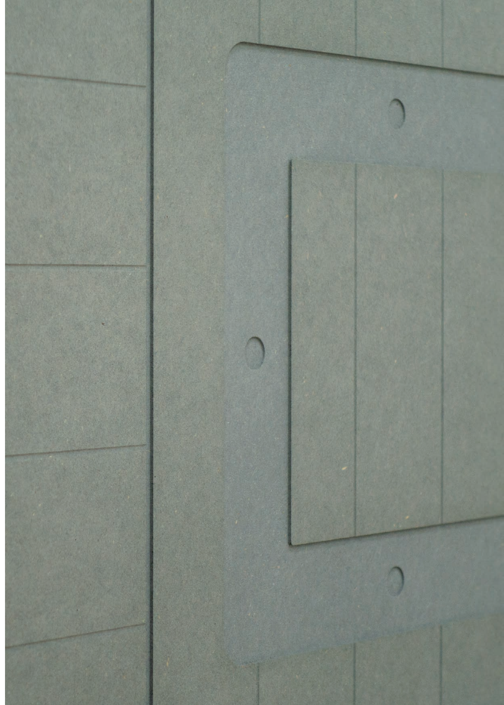
Detail Fritz Lehmann Klappe