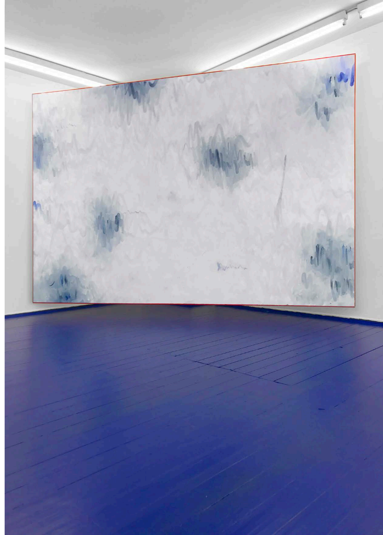
Die Welt ist leer gut Öl auf Nessel (Künstlerrahmen)/ Oil on nettle (artistframed) 200 x 300 cm · 2017