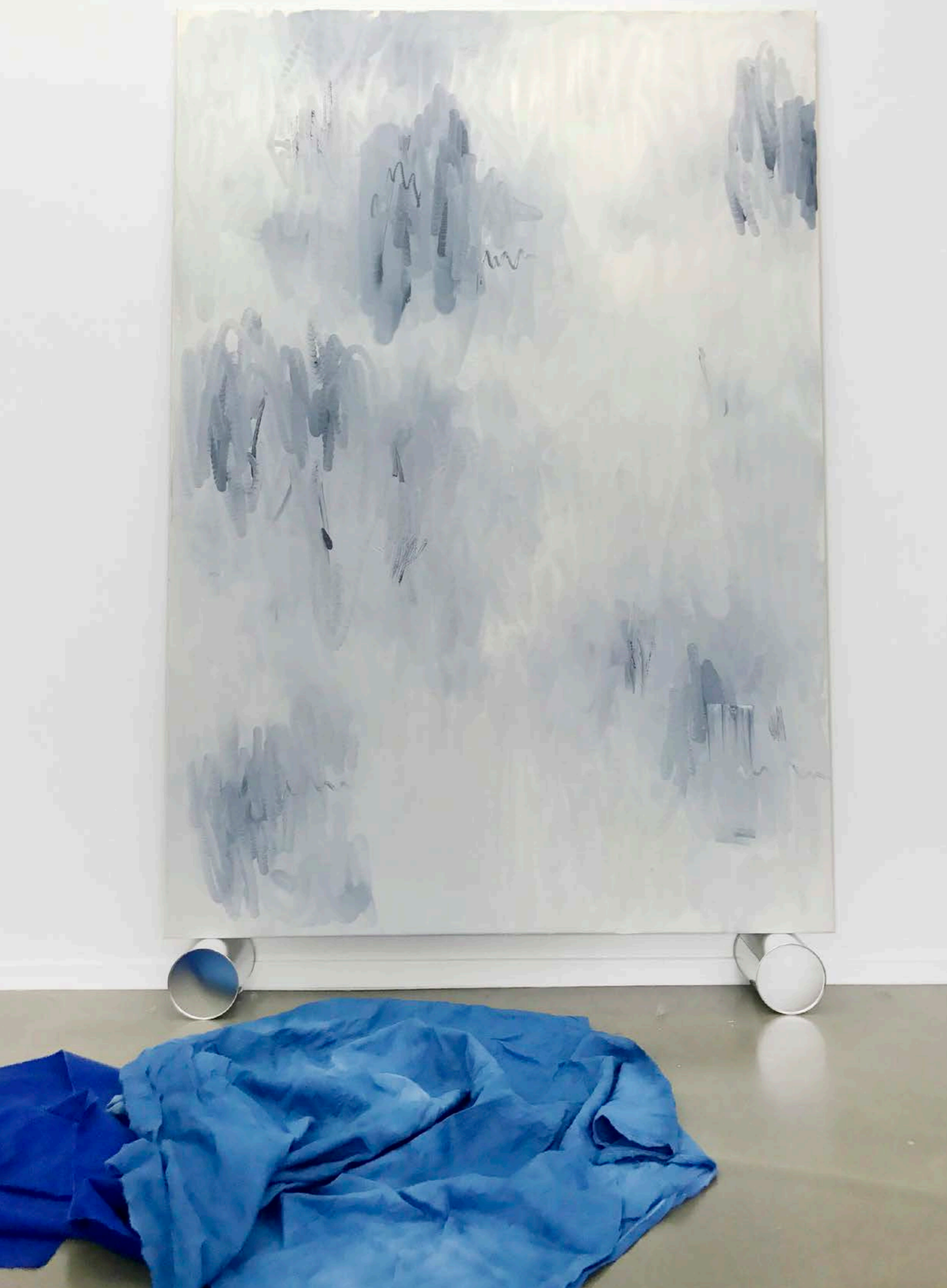
Mehr oder weniger

Öl auf Nessel/Oil on nettle · 200 x 140 cm 2017