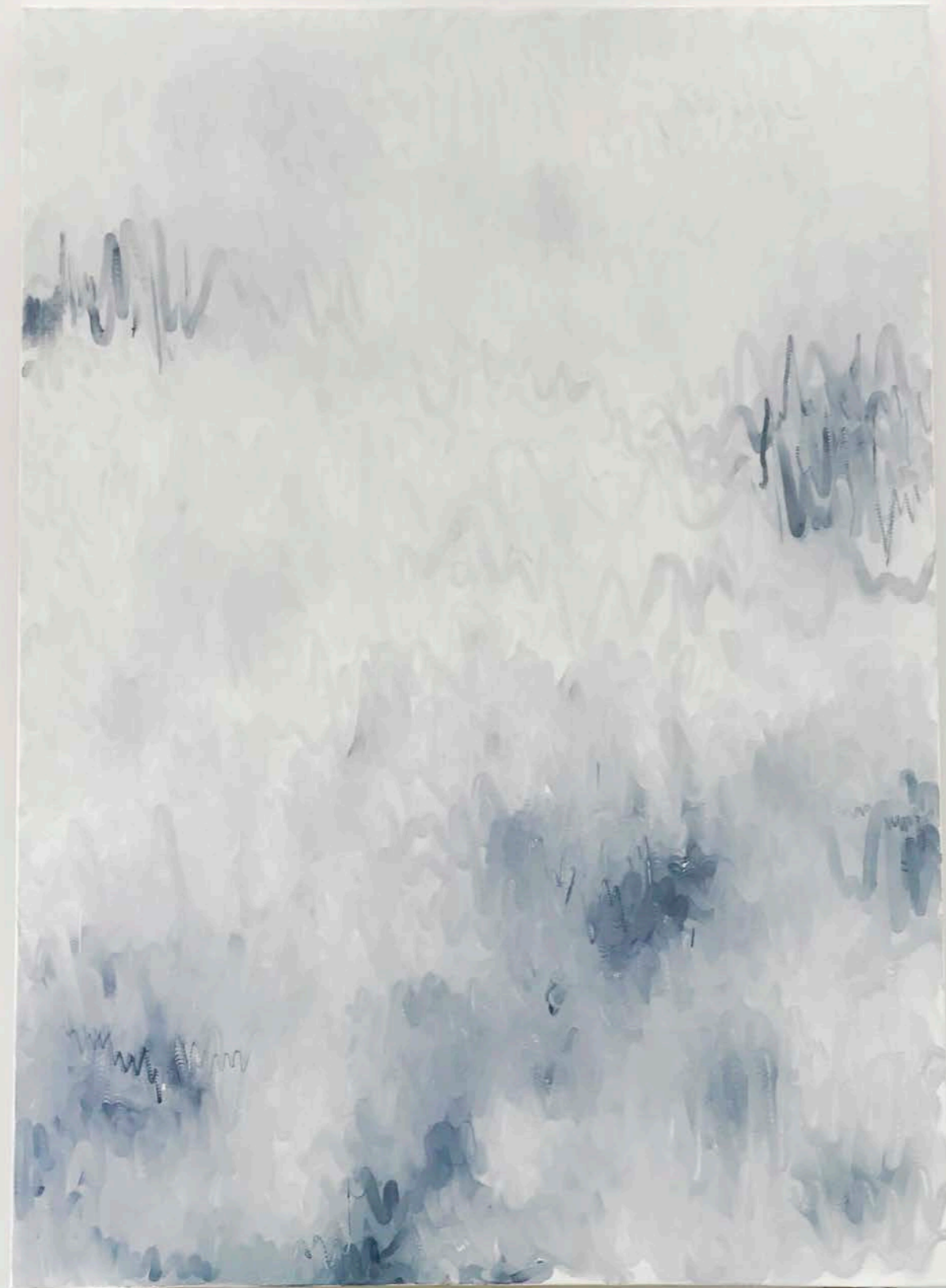
noch schon, noch, noch schon Öl auf Nessel/Oil on nettle · 200 x 140 cm 2017