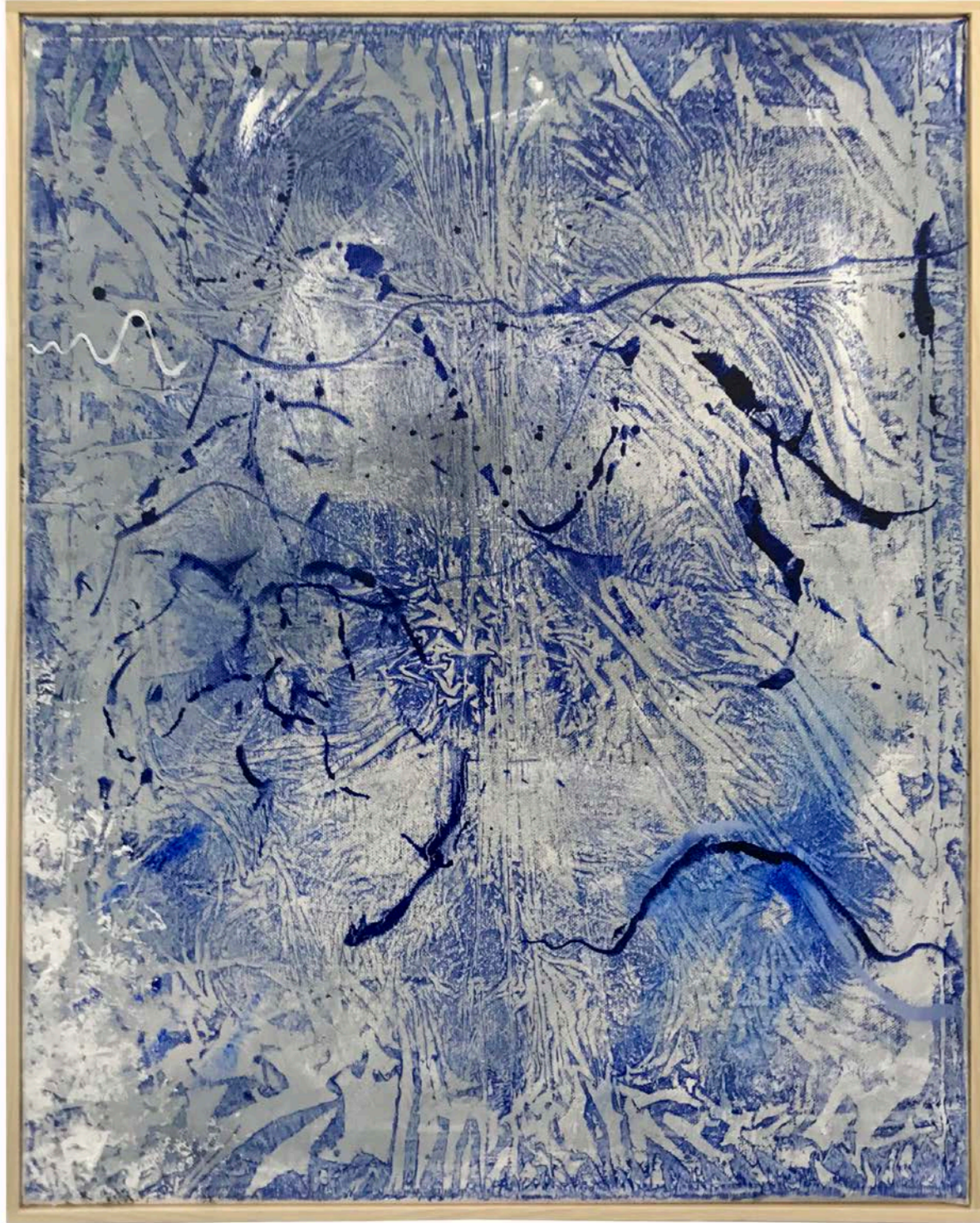
Antifantasiegedanken Öl auf Leinwand (Künstlerrahmen)/ Oil on canvas (artistframed) 40 x 50 cm · 2017