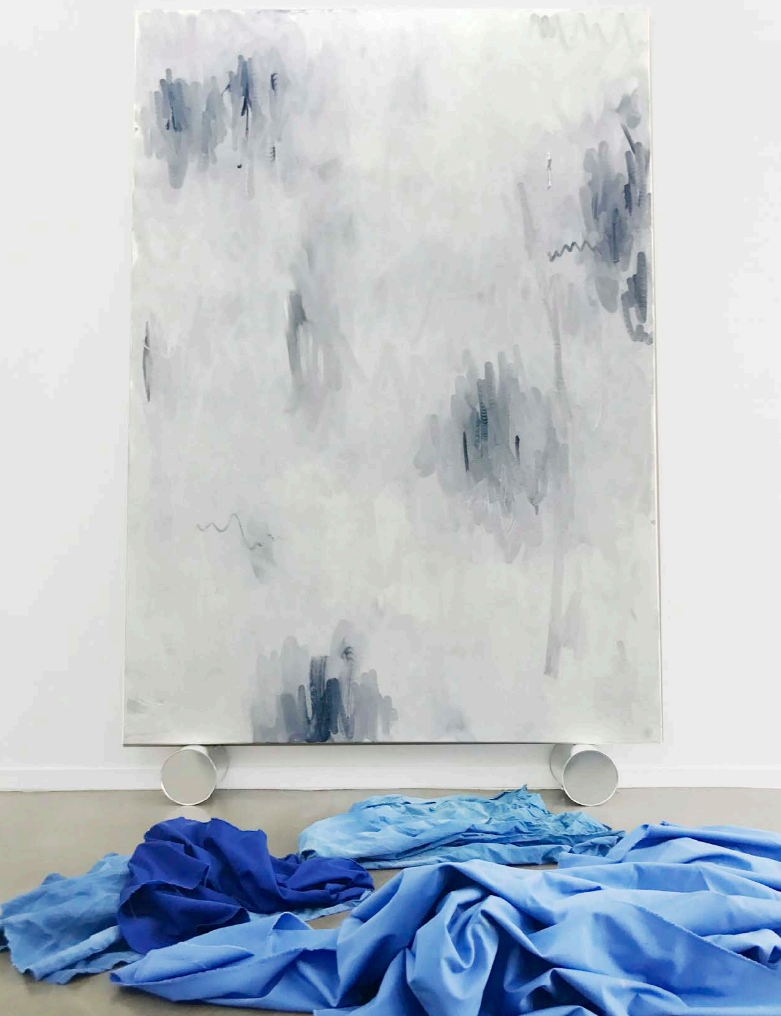
Gestern, Morgen und nicht Heute Öl auf Nessel/Oil on nettle · 200 x 140 cm 2017