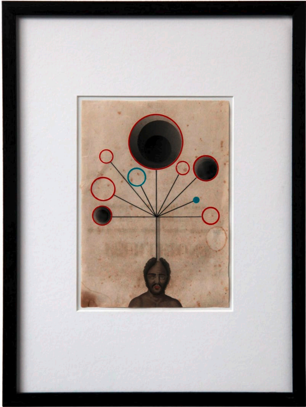
o.T. Collage auf Buchseite · 35,5 x 26,5 cm gerahmt · 2011