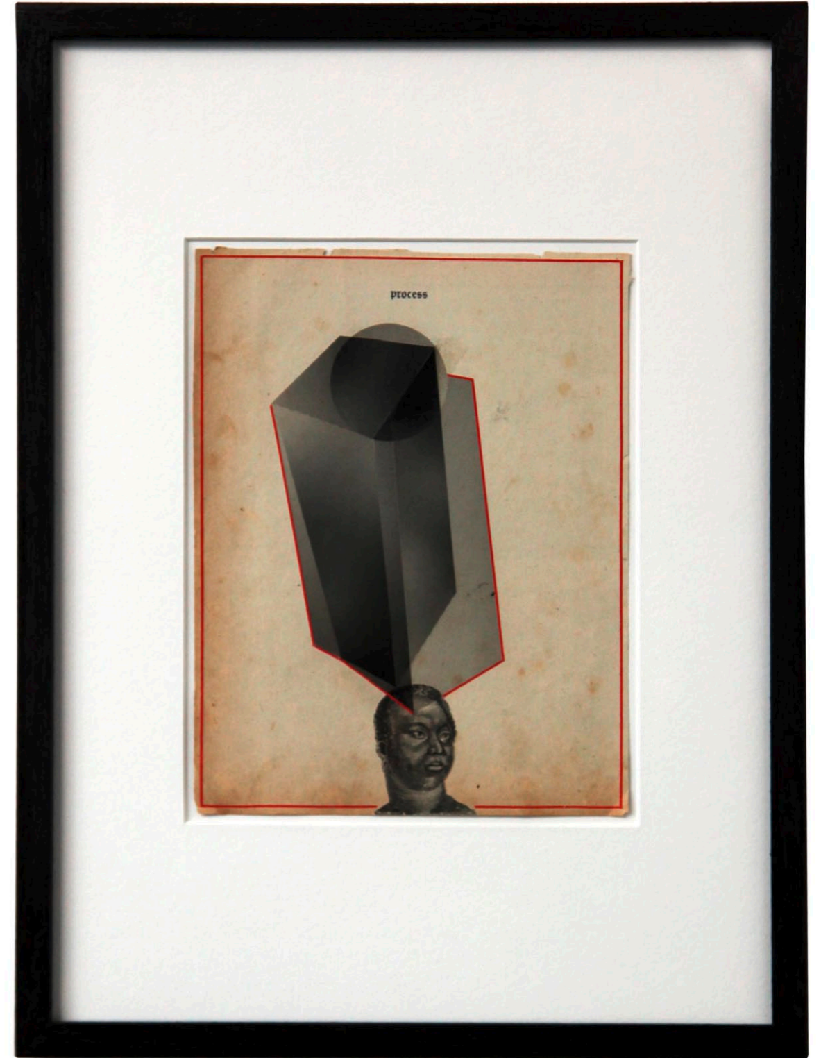
o.T. Collage auf Buchseite · 35,5 x 26,5 cm gerahmt · 2011