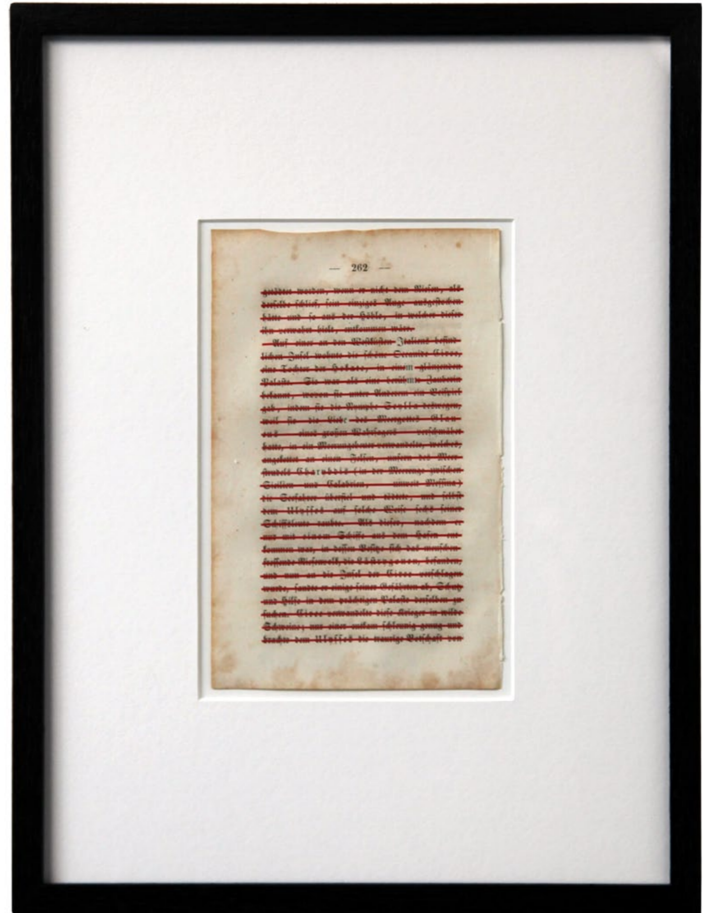
o.T. Collage auf Buchseite · 35,5 x 26,5 cm gerahmt · 2011