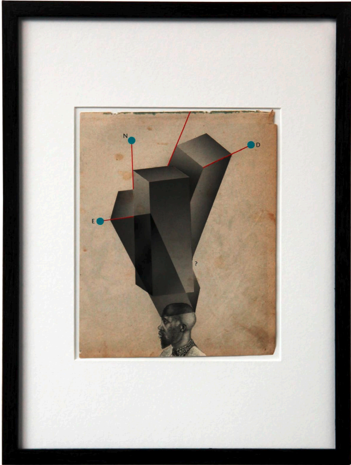
o.T. Collage auf Buchseite · 35,5 x 26,5 cm gerahmt · 2011