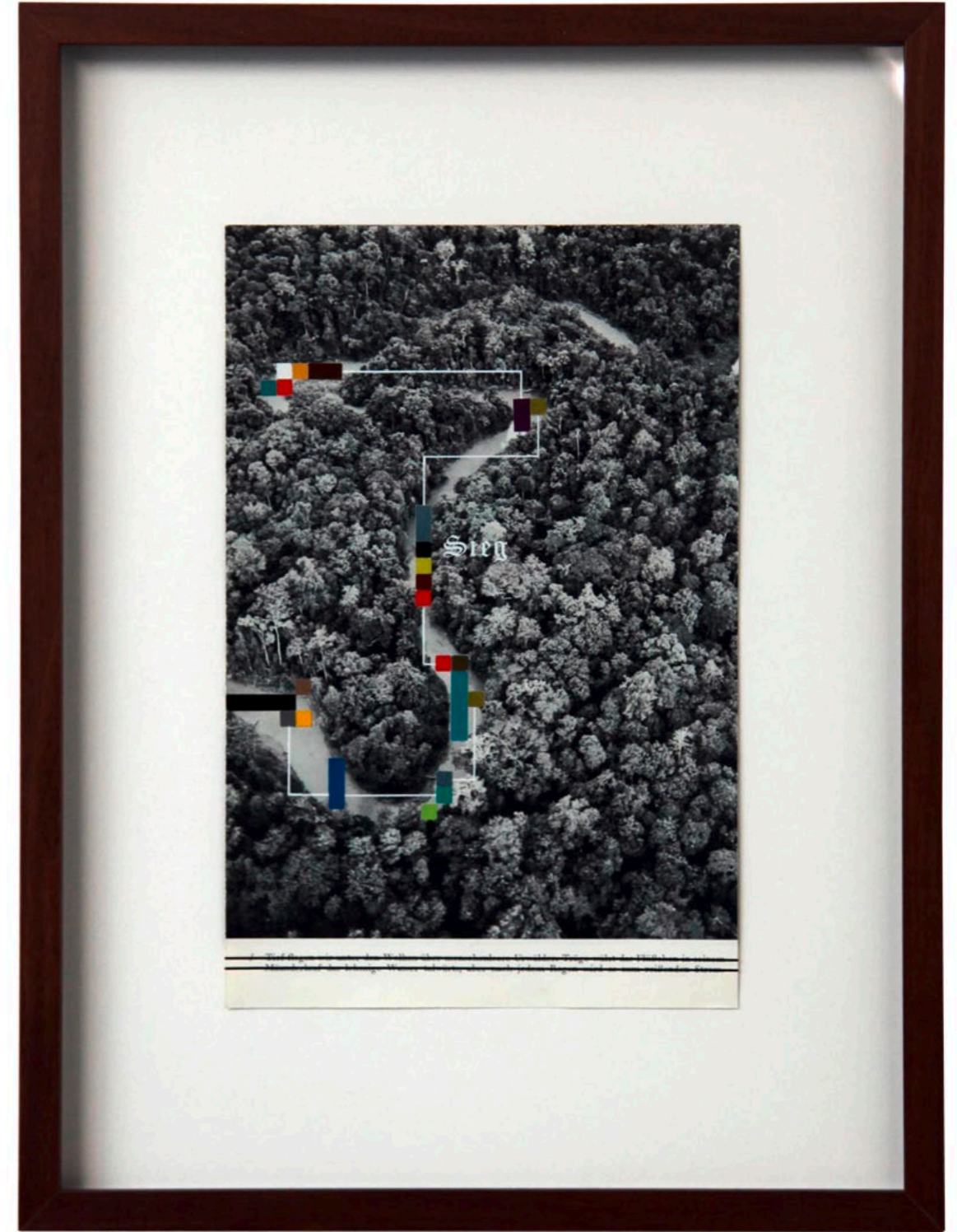
o.T. Collage auf Buchseite · 35,5 x 26,5 cm gerahmt · 2011