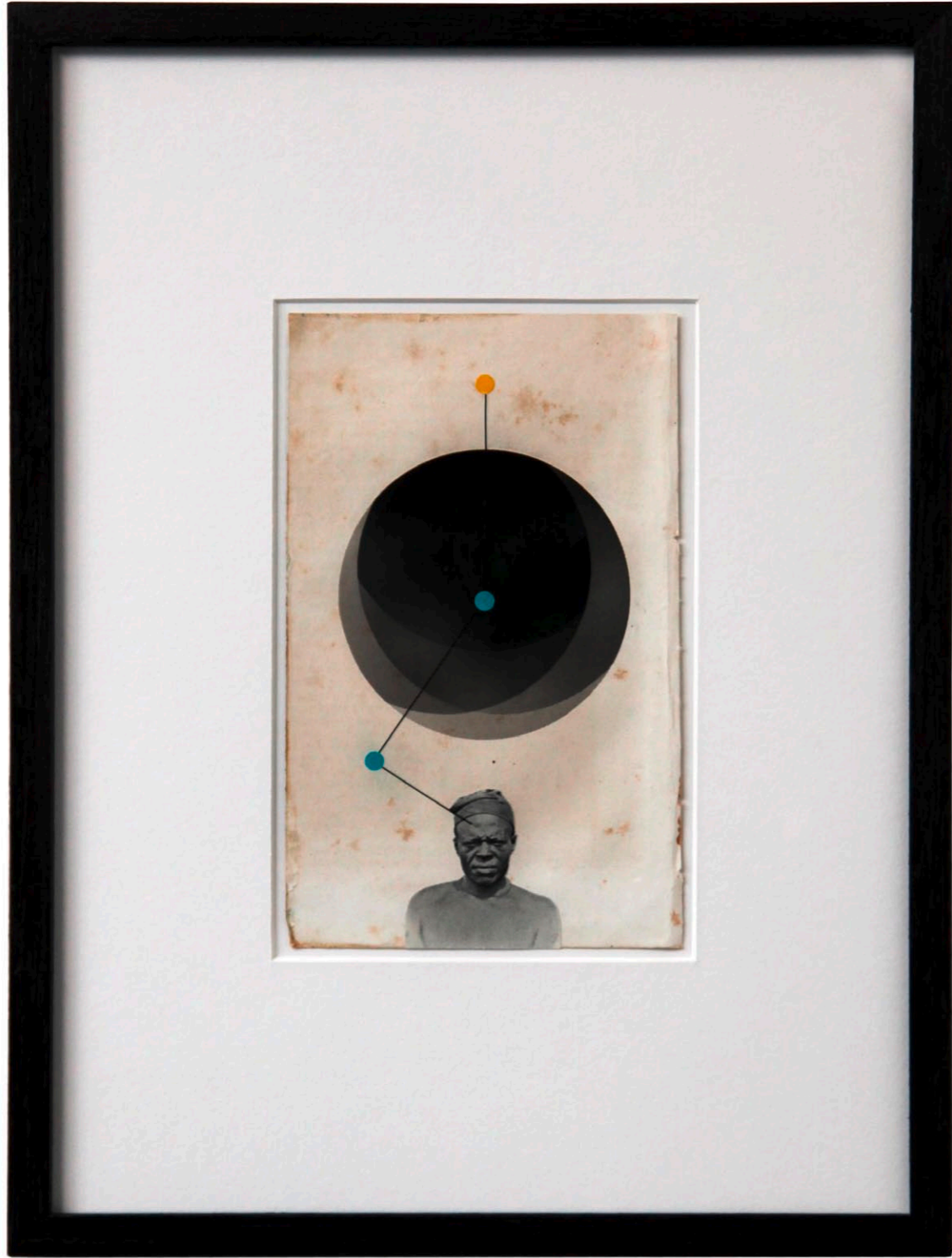
o.T. Collage auf Buchseite · 35,5 x 26,5 cm gerahmt · 2011