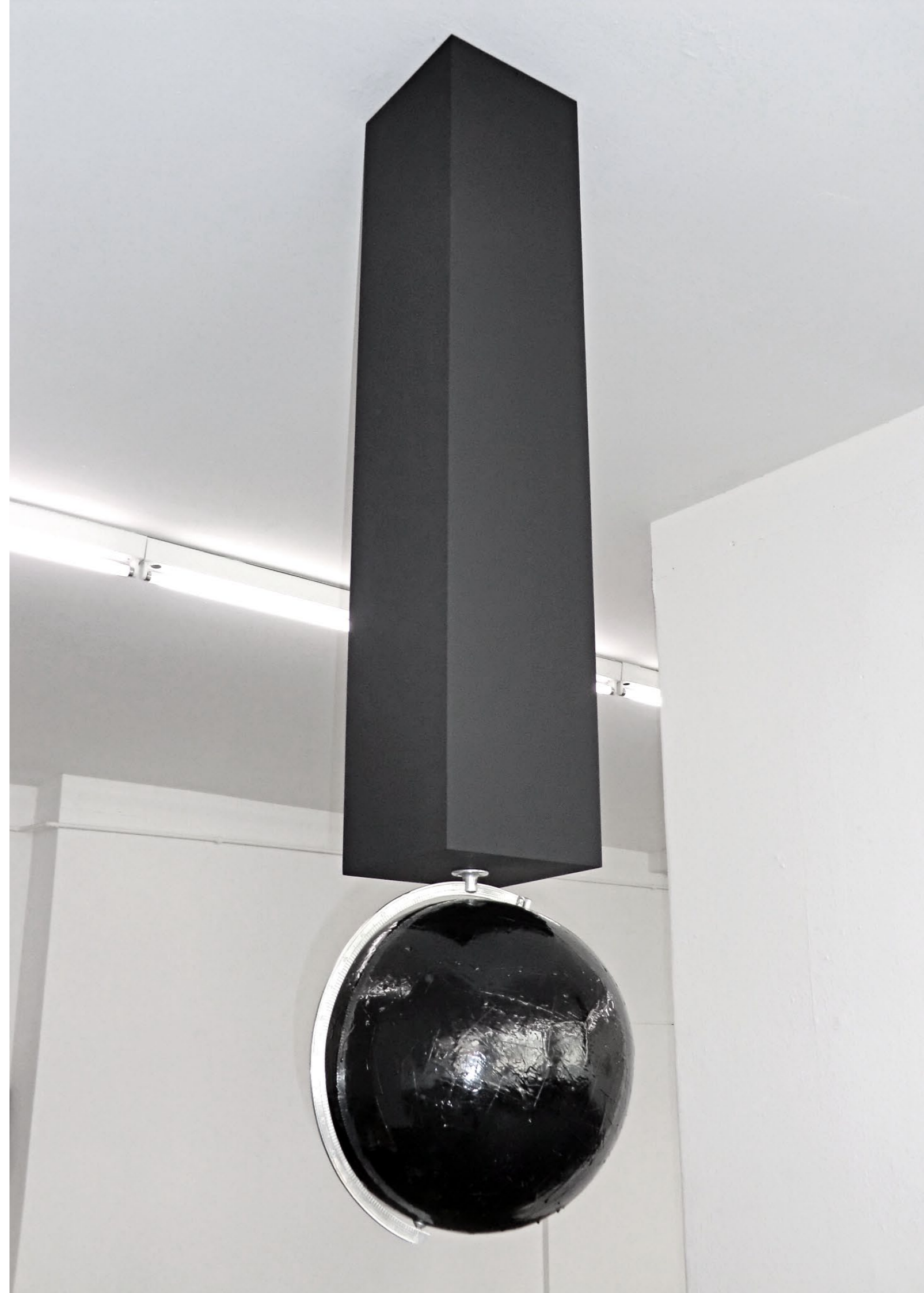
o.T. Holz, Globus & Lack · Maße variabel · 2010