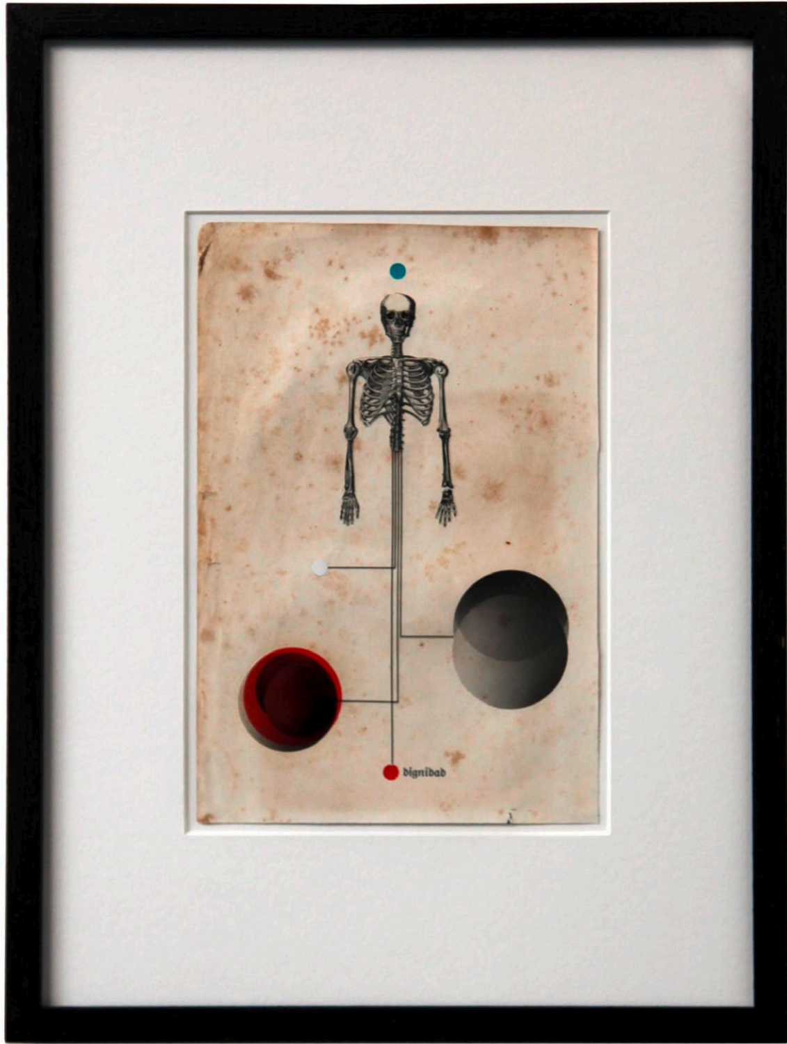
o.T. Collage auf Buchseite · 35,5 x 26,5 cm gerahmt · 2011