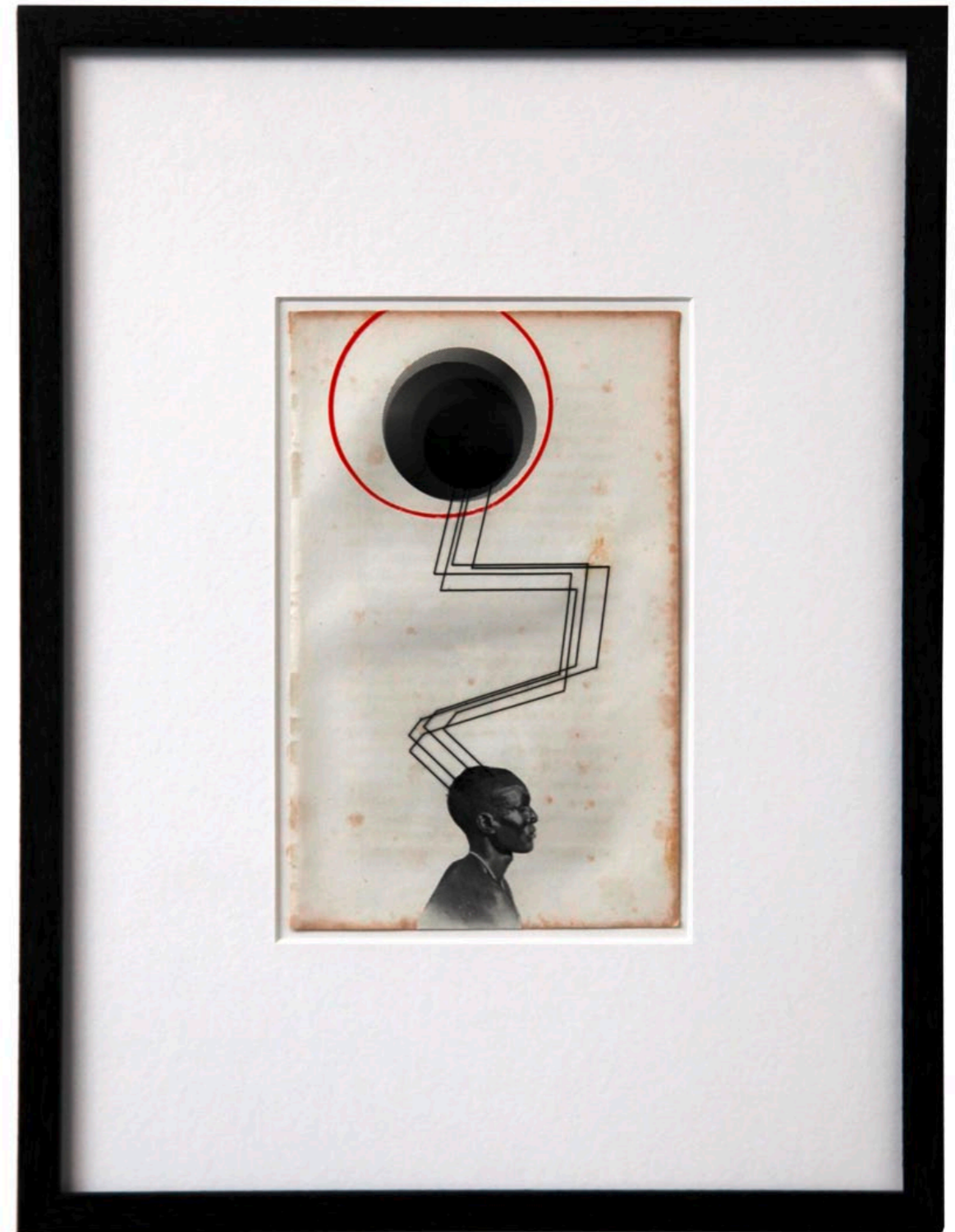
o.T. Collage auf Buchseite · 35,5 x 26,5 cm gerahmt · 2011