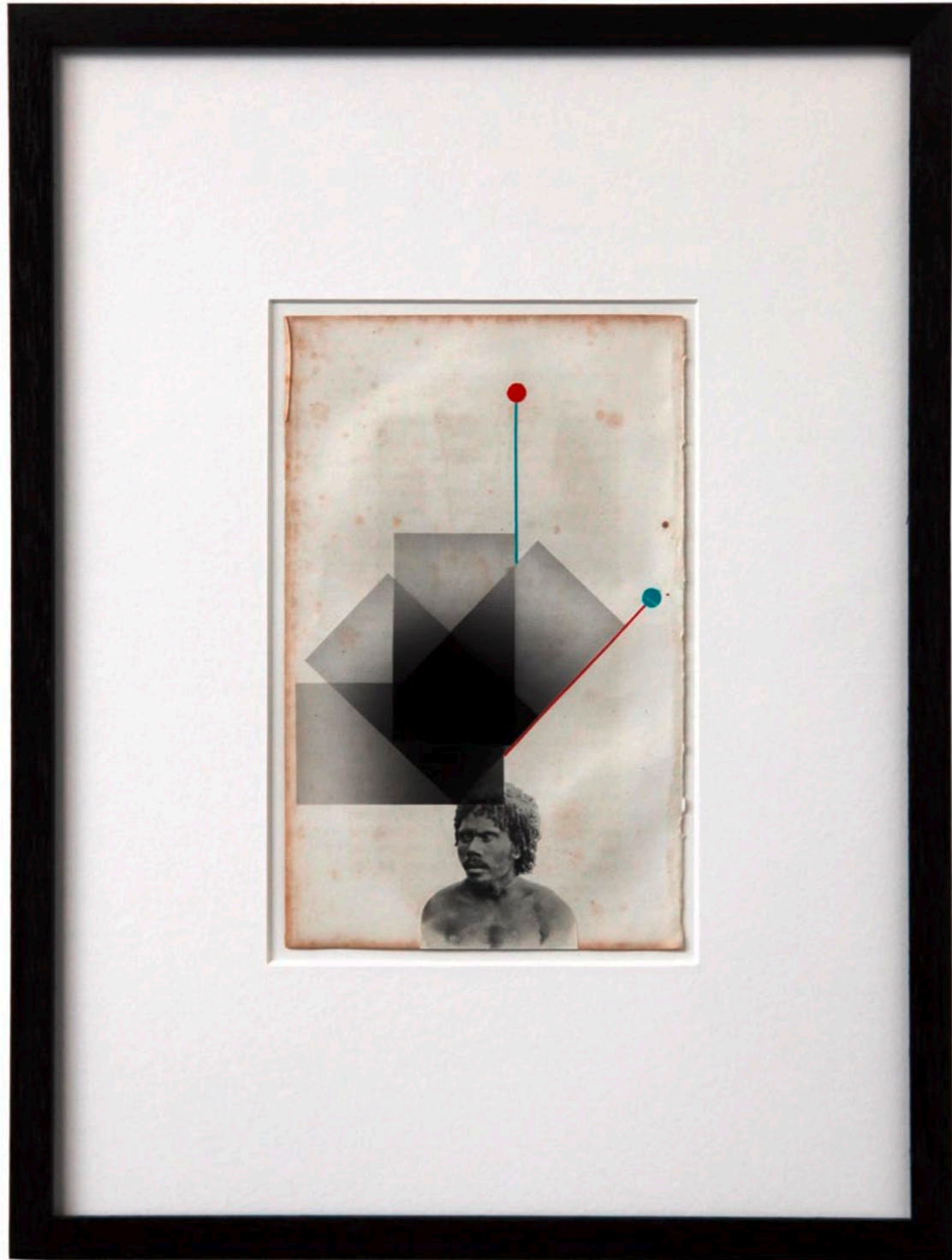
o.T. Collage auf Buchseite · 35,5 x 26,5 cm gerahmt · 2011