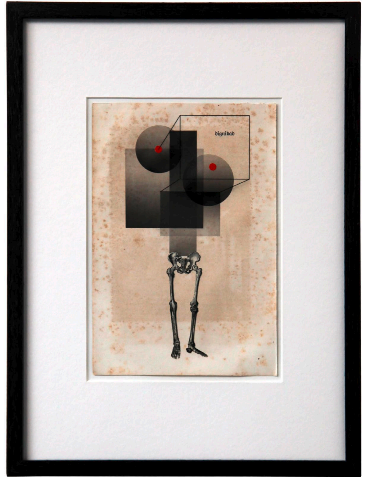
o.T. Collage auf Buchseite · 35,5 x 26,5 cm gerahmt · 2011