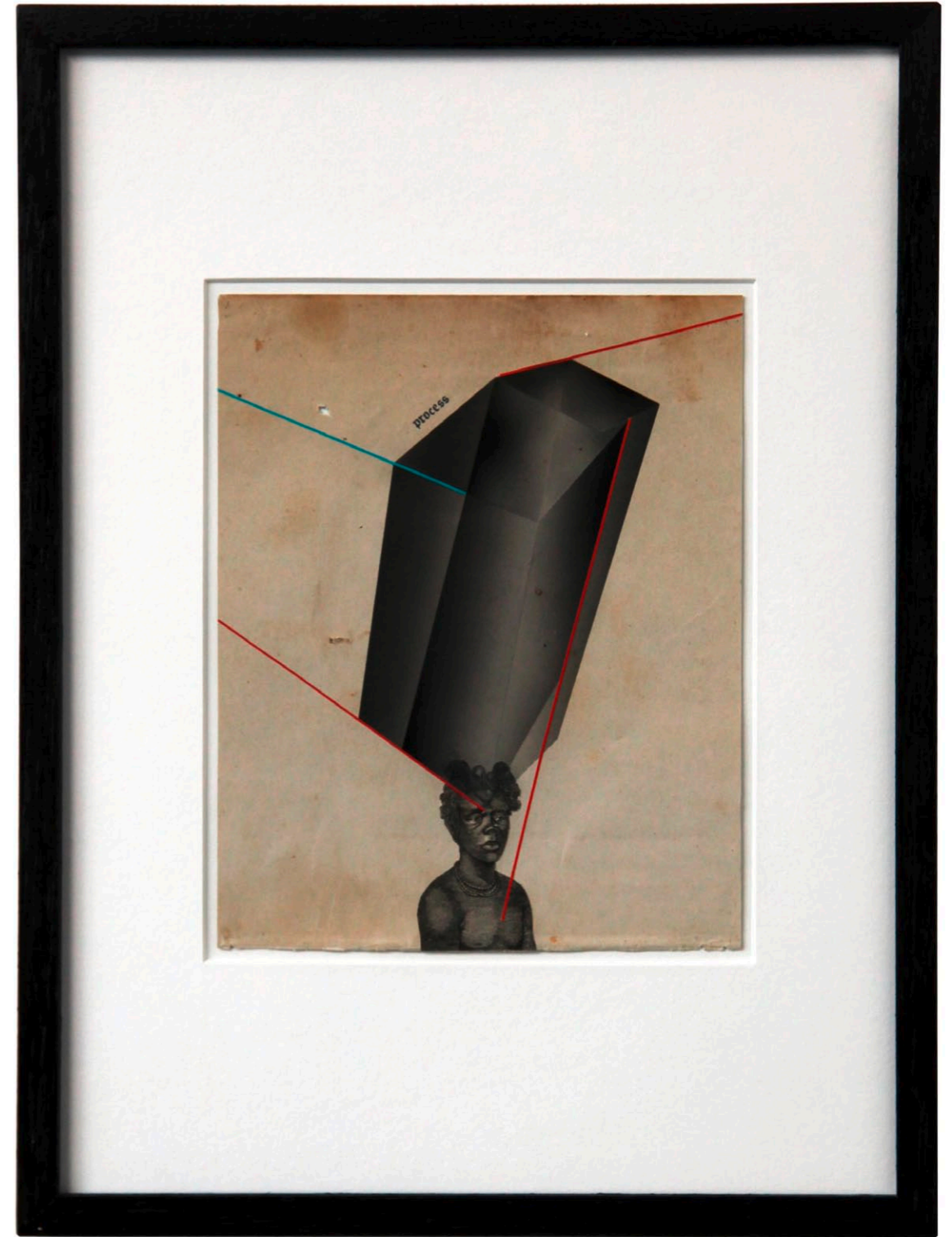
o.T. Collage auf Buchseite · 35,5 x 26,5 cm gerahmt · 2011